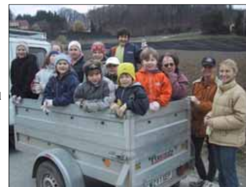
Auch die Jüngsten waren voll bei der Sache

Ebenso eifrig brachten sich auch die Schüler und Lehrer der 3b Klasse der Hauptschule ein. Sie reinigten penibel genau Plätze und Müllsammelstellen in St. Ruprecht.