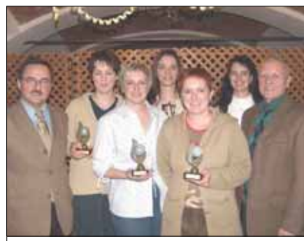
Gemeindevorstand mit der ESV-Damenmannschaft

Die Liste der geehrten SportlerInnen finden Sie unter „Aktuelles“ auf unserer Homepage: www.st.ruprecht.at