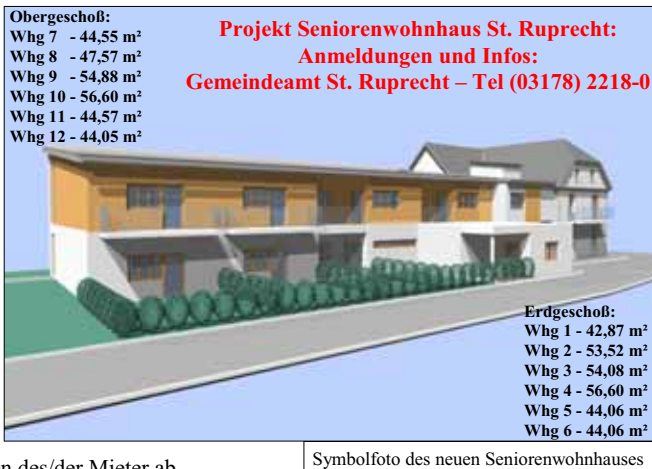
Symbolfoto des neuen Seniorenwohnhauses

Die Baukosten werden durch ein Direktdarlehen des Landes Steiermark bedeckt, wodurch die Wohnungen auch voll wohnbeihilfenfähig sind. Die Höhe der Wohnbeihilfe hängt dabei vom Einkommen des/der Mieter ab.