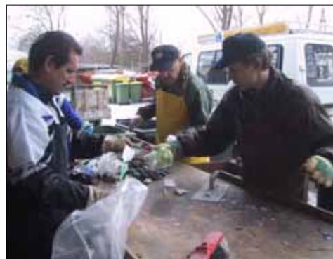
Müll wurde nicht nur gesammelt, sondern auch getrennt

Die Umweltsektion des FC-Donald organisierte auch heuer wieder die Reinigung der Lauf- und Wanderwege in und um St. Ruprecht/Raab. Besonders aktiv unterstützt wurde der FC-Donald von der Privaten Volksschule St. Ruprecht mit ihren 130 Schülern und ihrem Lehrkörper. Sie führten eine ganze Woche lang ein Müllprojekt mit allen Klassen durch.