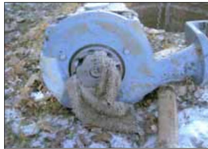
kaputte Schlammpumpe durch Reinigungsmopp