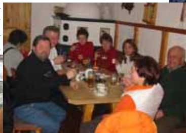
Weitere Fotos finden Sie natürlich auf der Fotogalerie unserer Homepage.