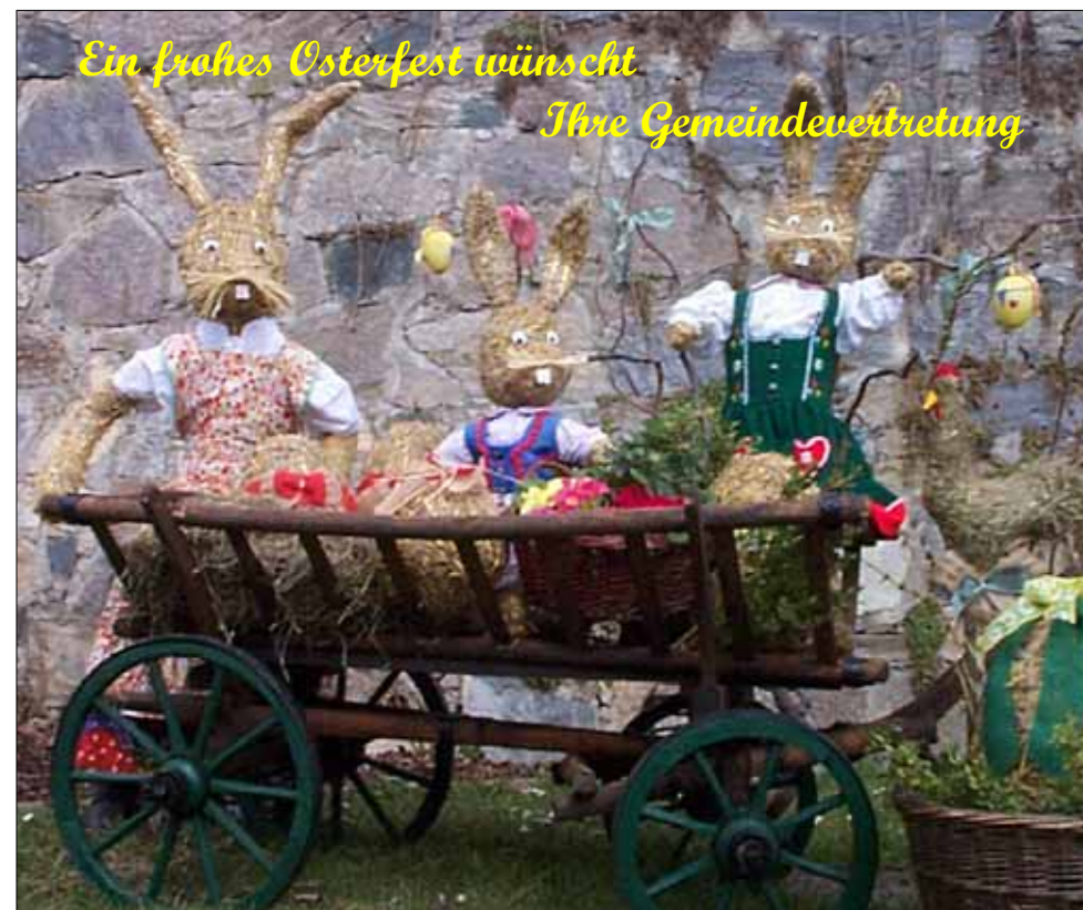
Osterhasenfamilie am Hauptplatz