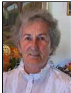
Hammer Charlotte 80 Jahre