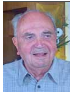
Locker Johann 80 Jahre