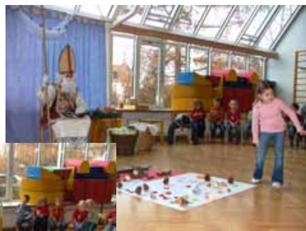
Frohe Weihnachten wünscht das Kindergartenteam

Die Tage zuvor versuchten wir die Kinder behutsam durch Geschichten, Lieder und Gedichte auf das Thema vorzubereiten. Gemeinsam achteten wir in der Gruppe auf ein gutes Zusammenleben der Kinder und so wurde es für sie eine Freude, als der Nikolaus ein Gemeinschaftsgeschenk brachte. Süßigkeiten und Schokolade standen im Hintergrund. Ein schön gedeckter Tisch und die gemeinsame Festjause ließen den Besuch des Hl. Nikolauses zum Erlebnis werden.