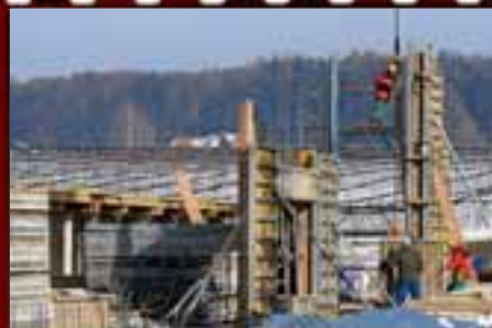
Die erste Schalung des Bühnenhauses