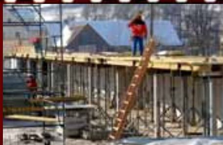
Die Decke über den Nebenräumen