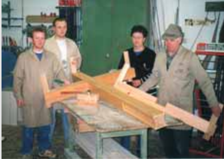
Das Team der Tischlerei Scharler beim Zusammenbau der Holzkreuze.