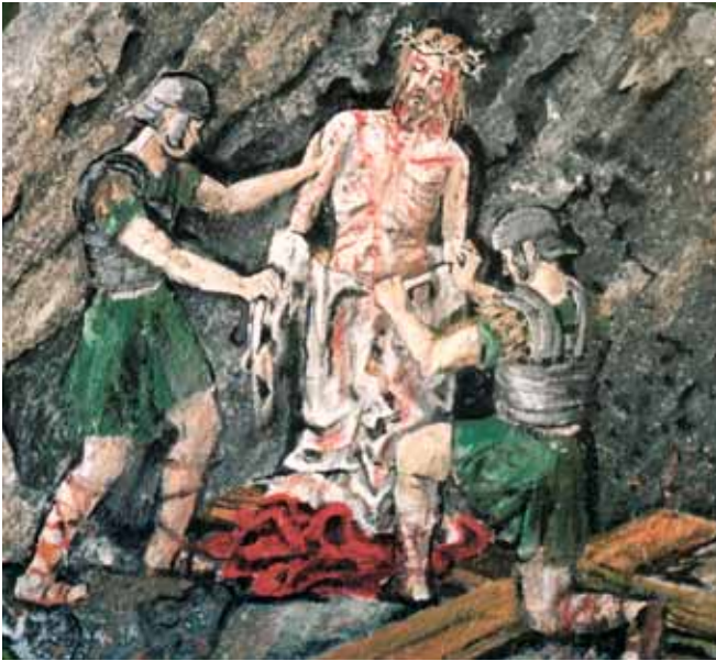
Jesus wird seiner Kleider beraubt

Menschen ihrer Würde berauben. Nackt und bloß wird Jesus den Blicken der Menschen preisgegeben.