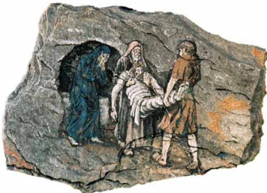
Jesus wird ins Grab gelegt

Gott, befreie uns von der Angst vor dem Leben. Wecke die Menschen, die ihr Leben nicht leben, aus ihren Gräbern auf.