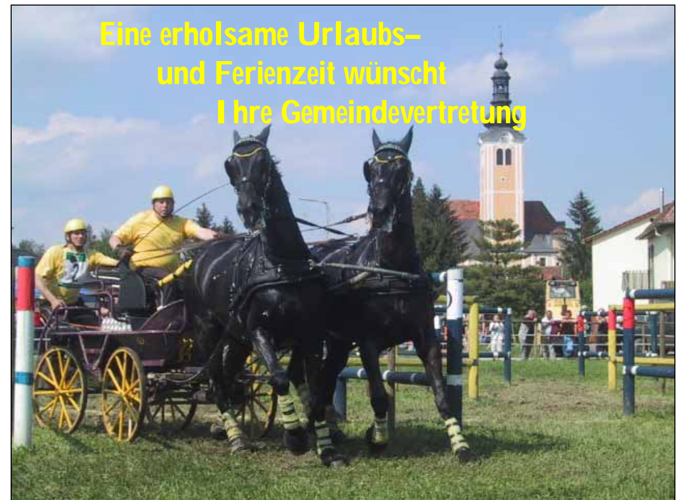
Gespannfahrer am Hindernisparcours