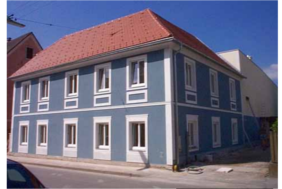
Das neue Seniorenwohnhaus

Die 12 Wohnungen mit Wohnnutzflächen zwischen 43 m 2 und 56 m 2 , die sowohl Alleinstehenden als auch älteren Ehepaaren ein neues Zuhause bieten sollen, können voraussichtlich ab 1. August bezogen werden. Die meisten der im Erdgeschoß gelegenen Wohnungen verfügen über einen Vorgarten, wogegen die Mehrzahl der über eine moderne Liftanlage erschlossenen Wohnungen im Obergeschoß einen Balkon aufweisen. Die Wohnungen sind voll wohnbeihilfenfähig, wobei die Höhe der Wohnbeihilfe vom Einkommen des/der Mieter abhängt.