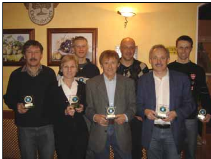
geehrte Sportler/Sportlerin des FC-Donald