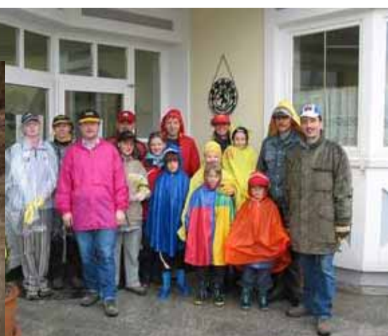
(weitere Fotos unter www.fc-donald.at )