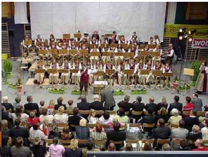
(Text und Bilder von Herbert Schneider) Weitere Fotos in der Fotogalerie von www.st.ruprecht.at