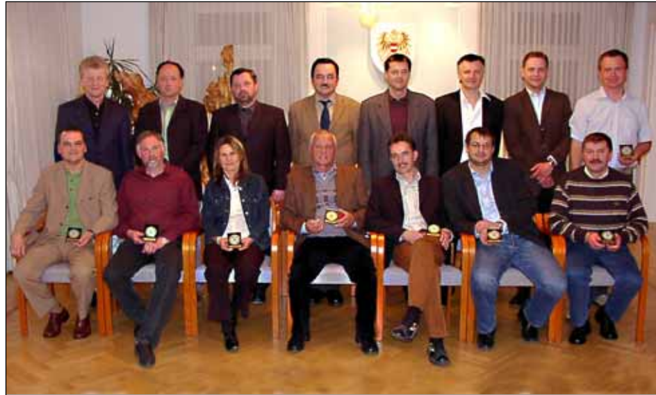
(gesamter „alter“ Gemeinderat - nicht im Bild: Friedrich Stenitzer)