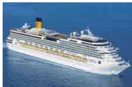
Foto: Eines der größten und modernsten Kreuzfahrtschiffe der Welt – Costa Serena

Für Kurzentschlossene kann noch versucht werden, auf Anfrage Plätze zu organisieren. Infos zur Reise gibt es in der Raiffeisenbank St. Ruprecht/Raab.