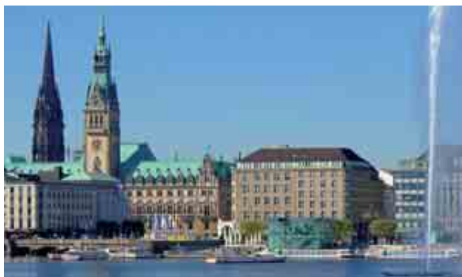
Foto: Zentrum von Hamburg