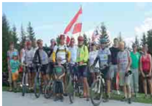
Foto: Der FC-Donald-Fan-Club auf dem Schöckel