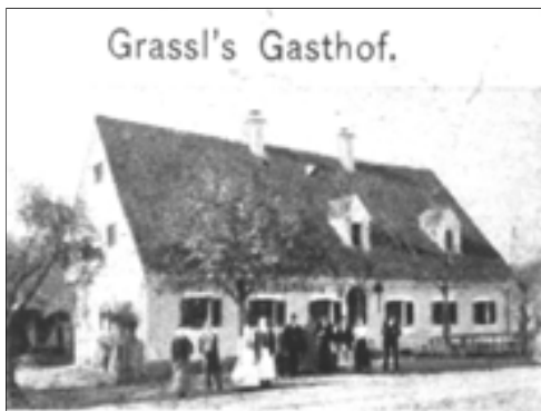
Der Gasthof Grassl stand gegenüber dem Anwesen Färber auf dem jetzigen Anwesen Unterfladnitz 14

Wir suchen Fotos, Postkarten, alte Ansichten, Bilder aus den Ortschaften, von Häusern aber auch von Vereinen, Bürgermeistern, Gemeinderäten etc. aus den Ortschaften der Gemeinde Unterfladnitz. Wir würden die Bilder gerne einscannen und in ein Gemeindearchiv eingliedern.